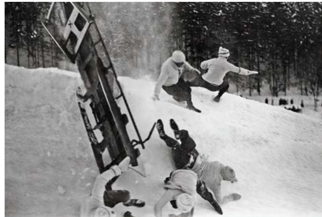
Eine Aufnahme, die glücklicherweise Seltenheitswert hat: Um 1917 verunfallte ein Bobschlitten im Eiskanal von St. Moritz.