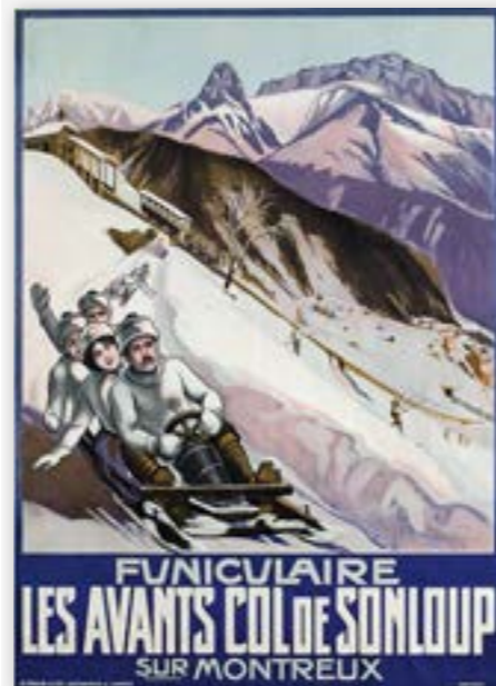
Wintervergnügen für alle: Bewerbung des Bobsports in Les Avants.