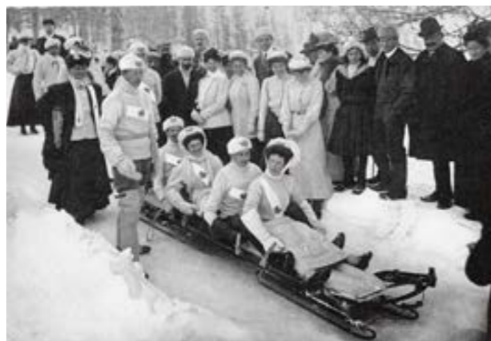
Damen steuerten mit: Bobfahren war schon 1908 ein Vergnügen für beide Geschlechter. Dem deutschen Kronprinzen Wilhelm (vorne links) blieb die Stastistenrolle.