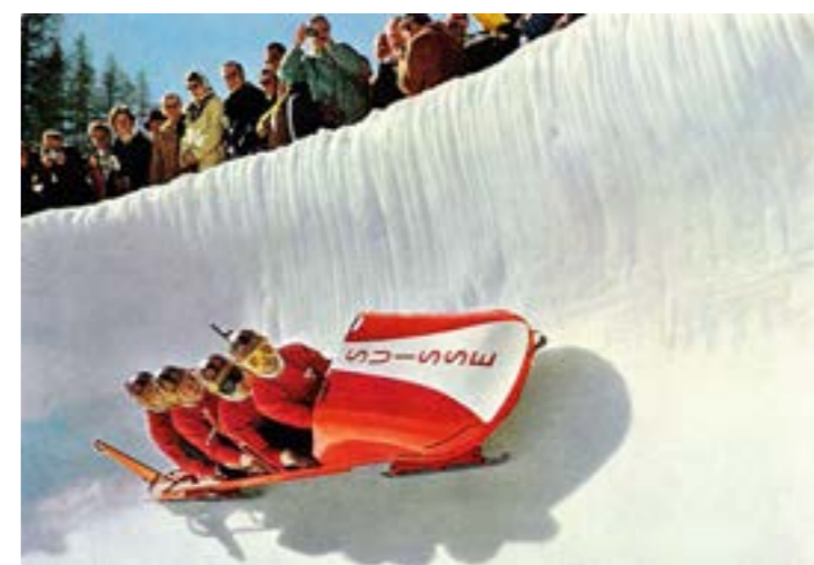
Mit der Technik stiegen die Anforderungen: Ende der 1950er-Jahre werden die Bobs immer aerodynamischer. Das erfordert von den Piloten ein gutes Reaktionsvermögen.